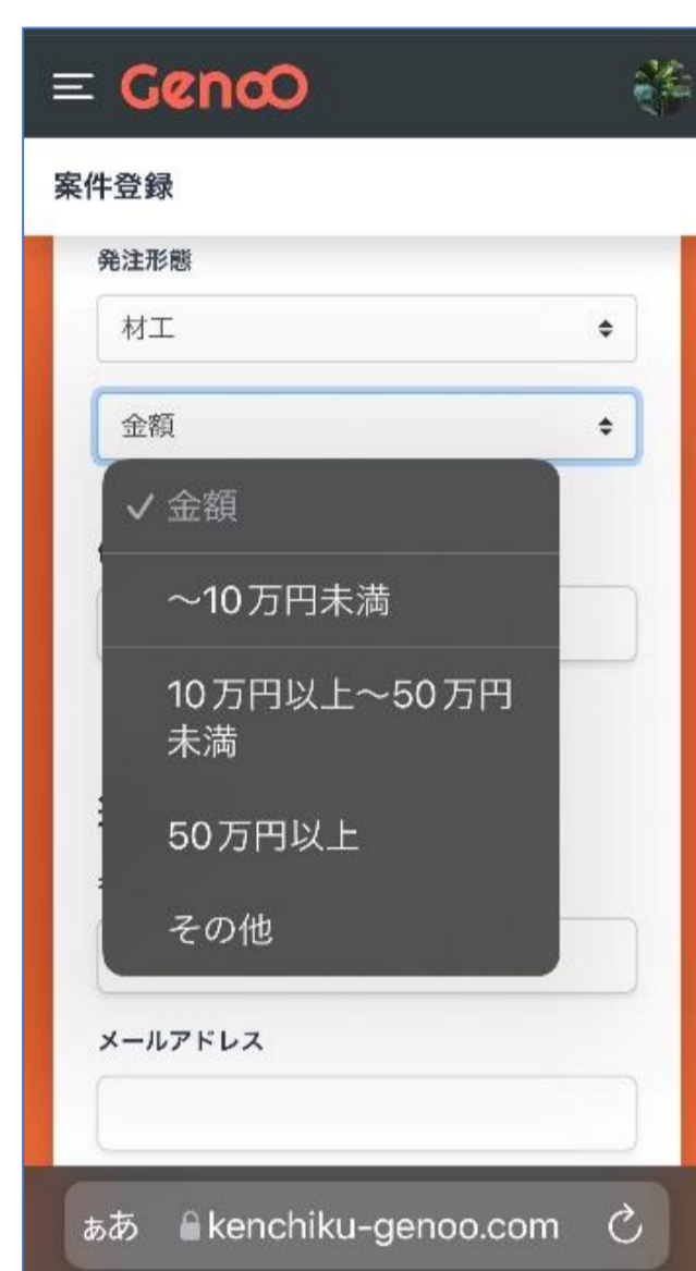
単価、材工 希望金額など