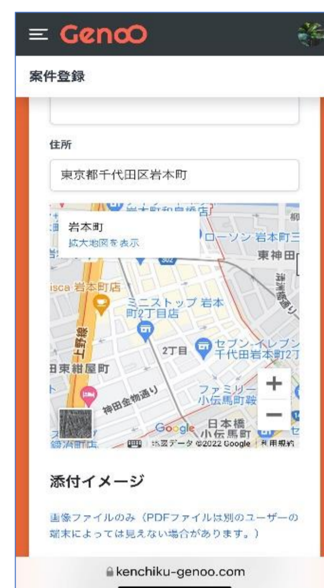
地図アプリ で現場表示