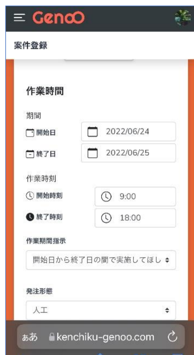
開始日、終了日 作業時間など