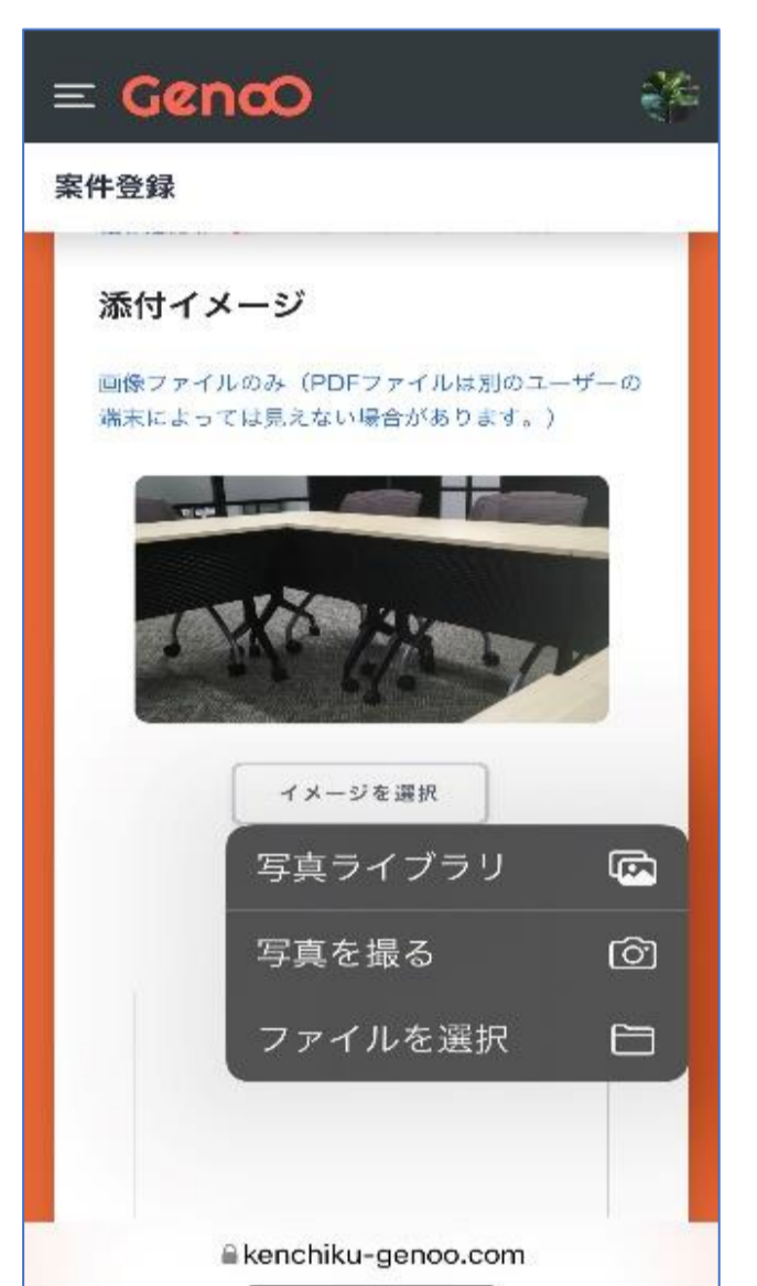
現場撮影、 ライブラリ などから